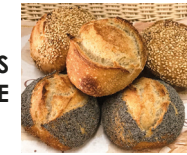
PETITS PAINS SERVIETTE