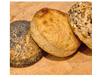
PAINS À BURGER